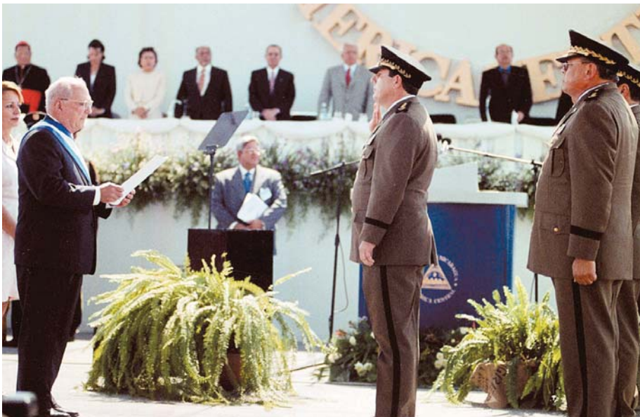
El señor Presidente de la República, Ing. Enrique Bolaños Geyer, toma la Promesa de Ley a la Comandancia del Ejército de Nicaragua, durante la Ceremonia de Toma de Posesión Presidencial.