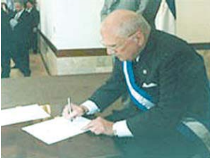
El señor Presidente de la República, Ing. Enrique Bolaños Geyer, firma el Libro de Actas en la Solemne Ceremonia de Transmisión de Mando Presidencial.