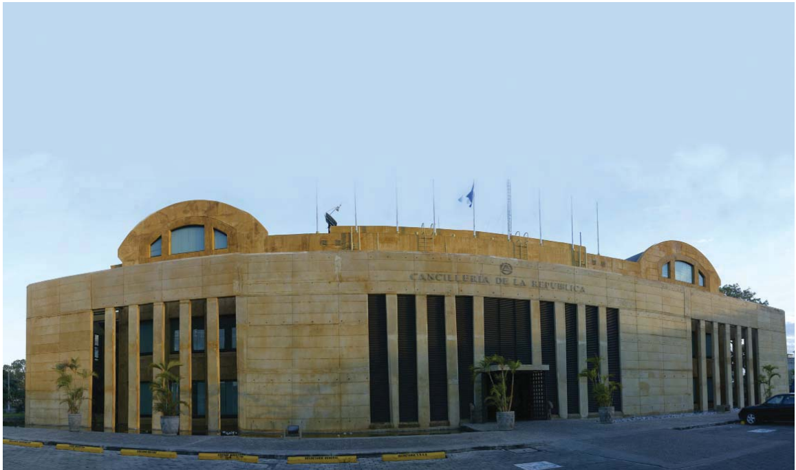
Ministerio de Relaciones Exteriores de la República de Nicaragua.