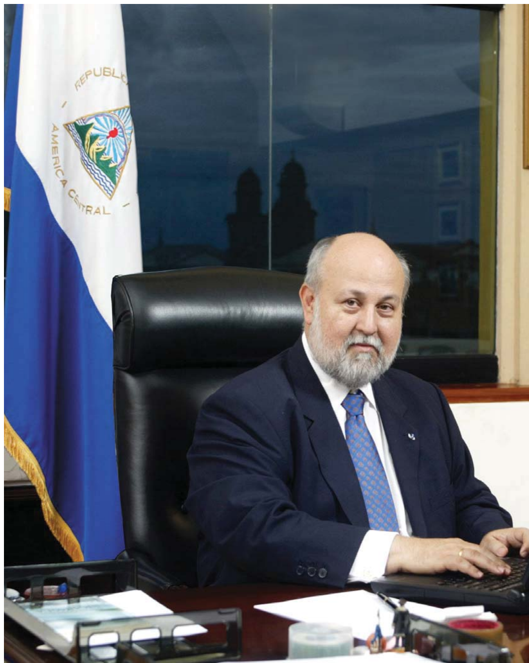
Ministro de Relaciones Exteriores Lic. Norman Caldera Cardenal