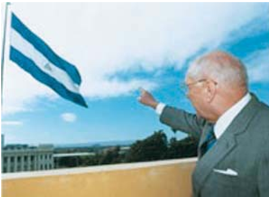
El Señor Presidente de la República, Ingeniero Enrique Bolaños Geyer, saluda desde el balcón de Casa Presidencial al inicio de su Gobierno.