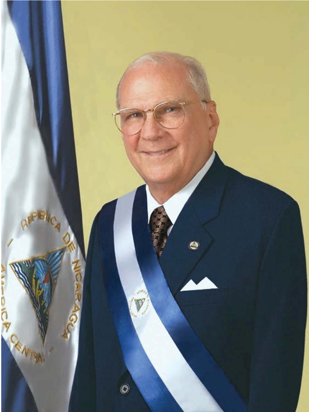
Presidente de la República de Nicaragua Ing. Enrique Bolaños Geyer