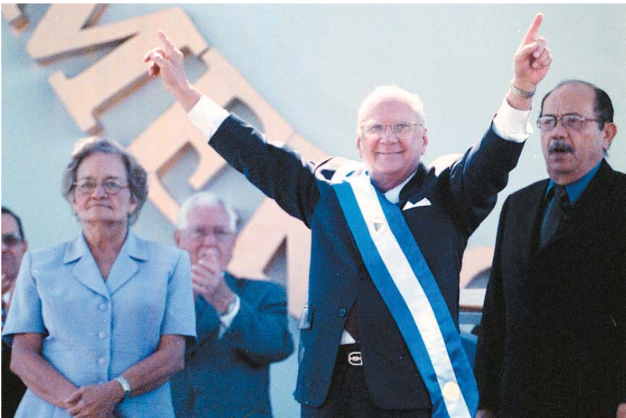
El Presidente electo de la República, Ingeniero Enrique Bolaños Geyer, saluda a invitados especiales, luego de la imposición de la Banda Presidencial en el Estadio Nacional.